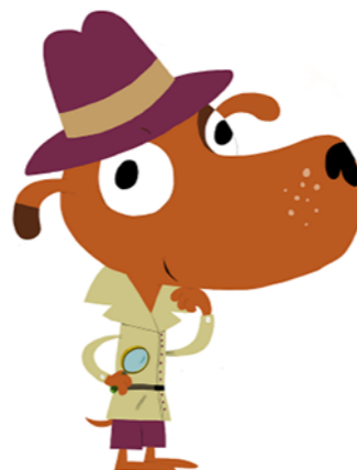
Illustration : © Hélène Convert, d'après un personnage créé par Nathalie Choux / Milan Presse 2020.

Des hors-séries pour les amoureux des sciences et des animaux, en plus de l'abonnement !